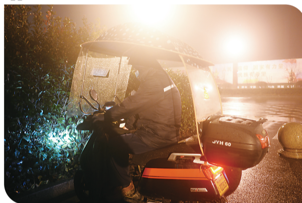
▲付湘江骑助力车冒雨赶到公交站