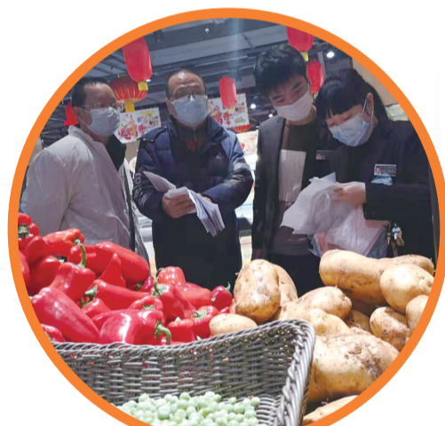
市市场监督管理局工作人员对商超、药店进行督查。

社会治安组向所有县市区教育局及直属学校转发省教育厅《关于做好2020年春季学期延迟开学工作的通知》,要求各地、各校充分利用网络平台和教学资源开展网上教学和指导,做到“停课不停学”。