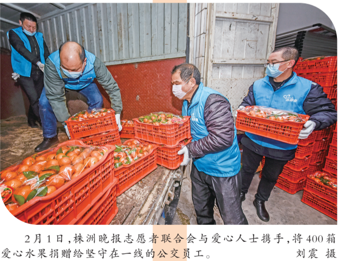
2月1日,株洲晚报志愿者联合会与爱心人士携手,将400箱爱心水果捐赠给坚守在一线的公交员工。