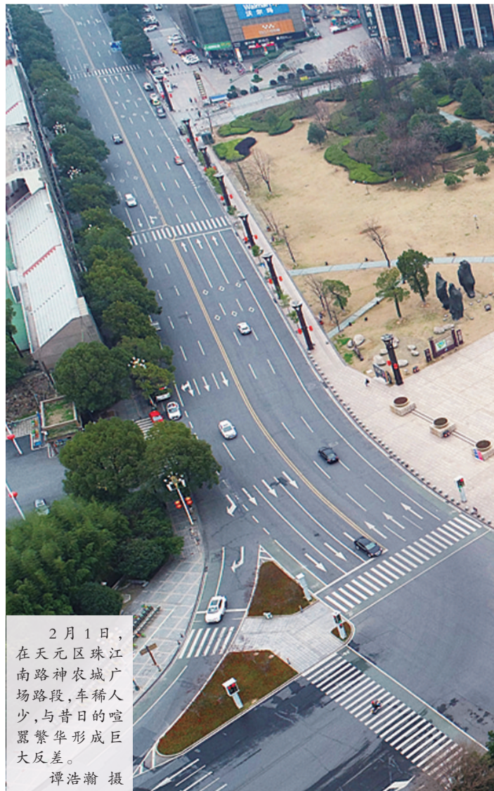
2月1日,在天元区珠江南路神农城广场路段,车稀人少,与昔日的喧嚣繁华形成巨大反差。