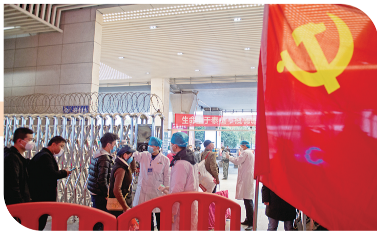
2月1日,株洲西站,党员岗的党旗挂在战斗第一线。

2月1日,正月初八,本应还散发着浓浓的年味。一场席卷全国的疫情,让这个春节,变成了人们记忆中最“冷清”的春节。新城株洲,也几乎变成了一座“空城”:昔日繁华的街道,变得空旷如也,店铺大门紧闭,街上行人稀少。 然而,当你去细细触摸这座城市的脉搏,你会发现,表面的寂寥之下,却奔涌着无数暖流。人们响应政府的号召,虽然“宅”在家中,却心系疫情,很多爱心人士为一线工作人员捐赠各类物资。更有众多的无名英雄,忙碌在街头小巷,为打赢这场没有硝烟的战争,做着行之有效、具体的防疫工作。那一幅幅的画面,看似平凡,在这特殊的时候,却直击人心:有人四处奔走,消毒防疫;有人奋战在医院,与病毒搏斗,挽救生命;有人坚守在各个交通要道,保护这座城市的咽喉;还有夫妻双双执手,携手抗疫…… 正月初八,株洲,虽街道空空,却有无数暖流在坚定地流动,为这座城市带来温情与温度。我们相信,不久的将来,我们必将迎来这座城市历史上一次不一样的春天,一次更明媚的春暖花开!