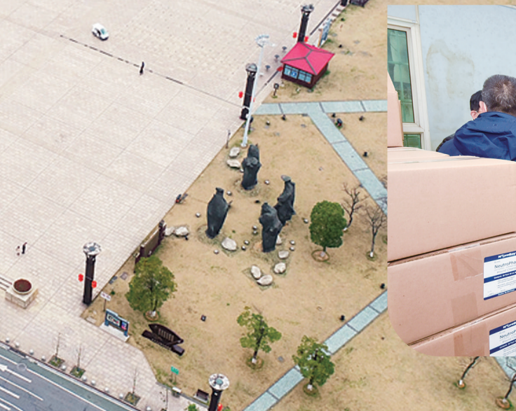
在市工信局,我市采集入库来的口罩等防疫物资,经过调度,向社会各界投放。