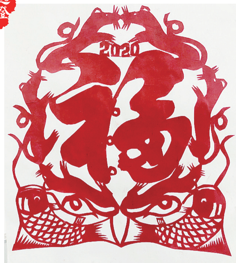
2020年,希望疫情赶紧过去,福气多多。 (作者:伍芬喜 77岁 天元区湘滨逸墅)