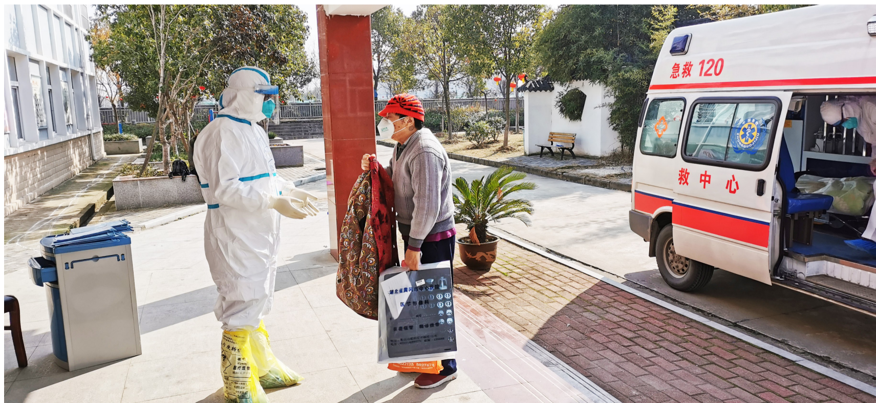
援鄂医疗队接待被救护车送来的患者。