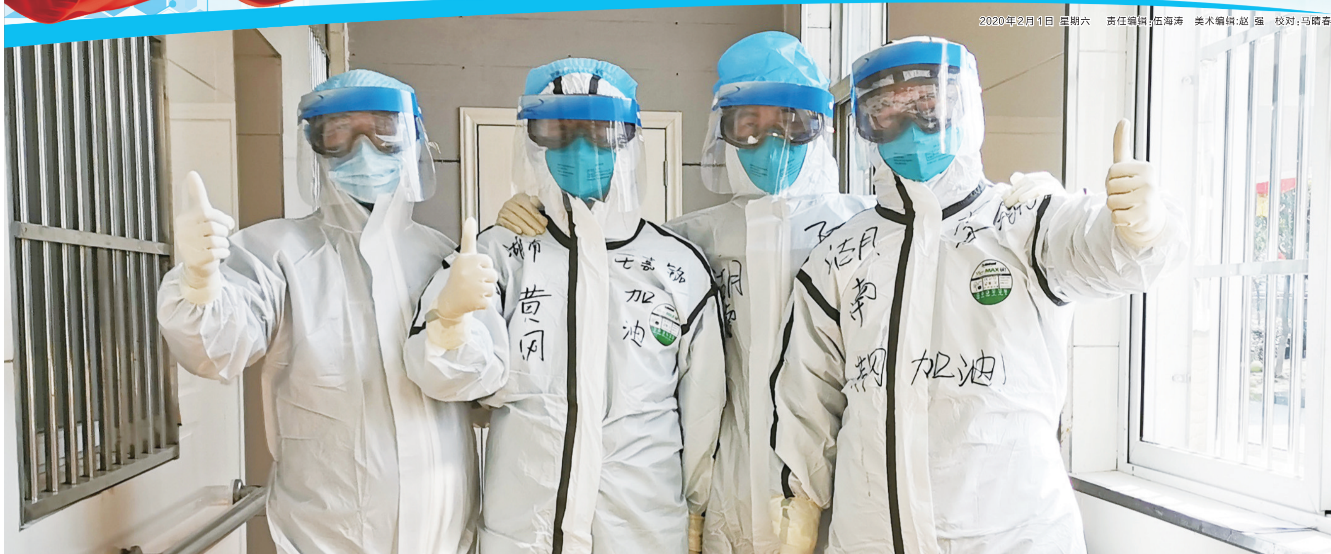
清晨,满怀信心,全副武装出发。