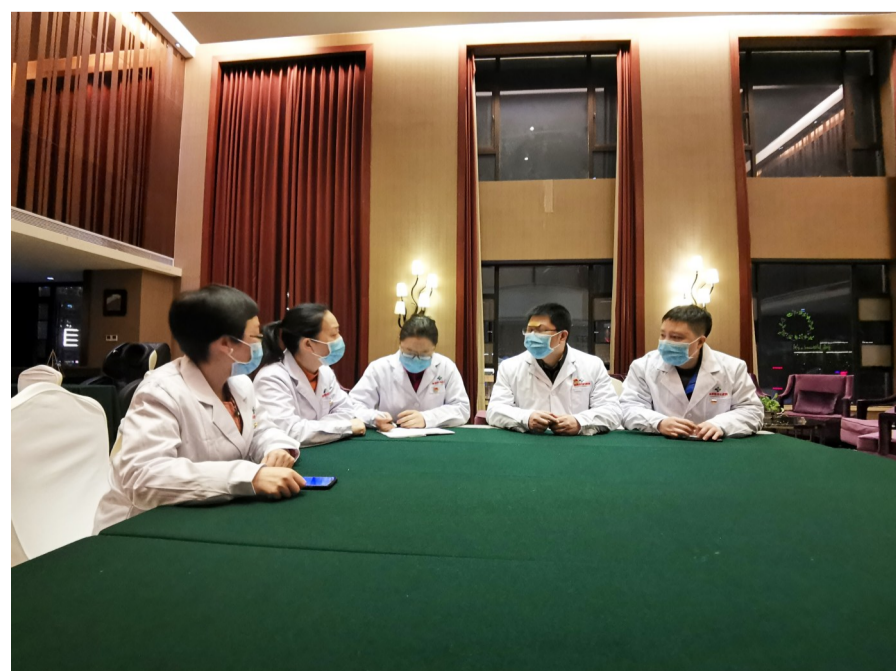
晚上10点多,医生们仍在讨论第二天的工作方案。