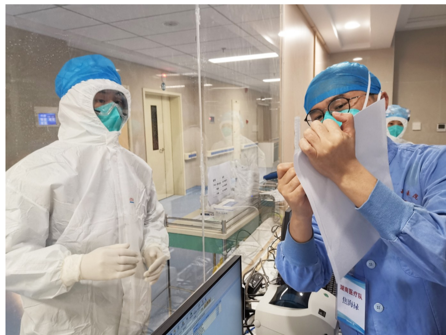
隔离区的交流只能用手势或文字。

疫情面前,谁都不怕,但因为身上有责任感,肩上有担当,他们选择“逆向”而行。让我们为这群天使折愿,口罩眼镜虽然遮住了他们的面容,但他们分明是我们心目中最美丽的人群!