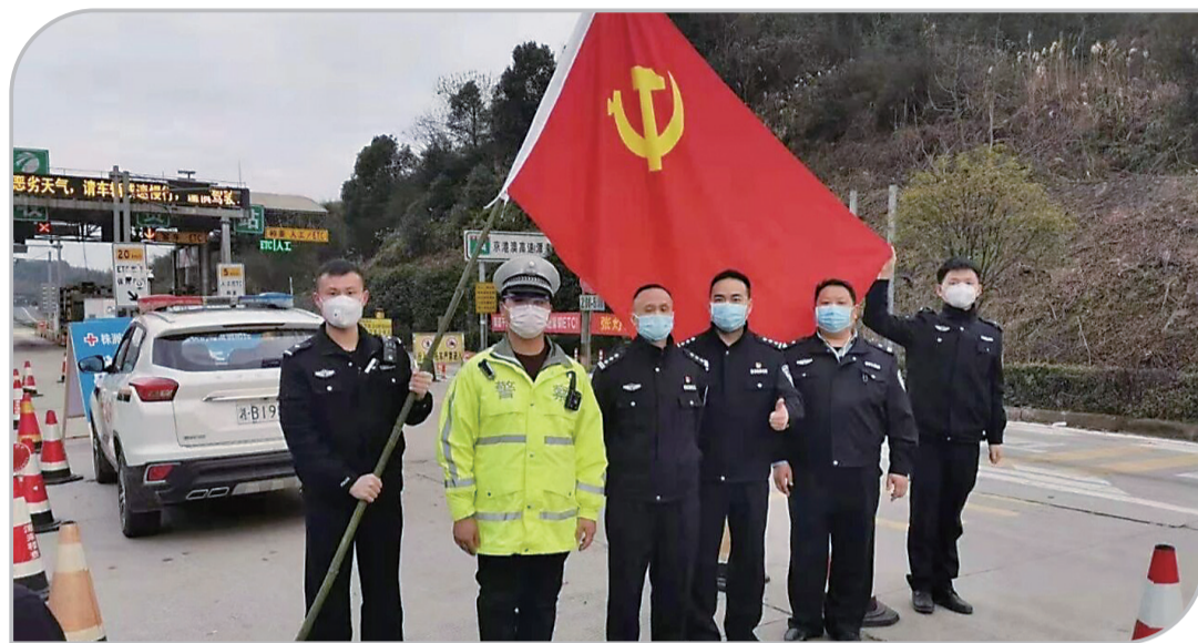
▲天元公安分局党员队伍战斗在防疫前线

1月28日,根据公安部和省公安厅下发的《关于全力做好新型冠状病毒感染的肺炎疫情防控工作方案》,天元分局党委再次进行研究,并于当日下午召开分局疫情防控工作紧急部署会议,下发了《株洲市公安局天元分局关于全力做好新型冠状病毒感染的肺炎疫情防控工作方案》,并明确了分局各单位配合区相关部门开展疫情防控工作的具体任务。