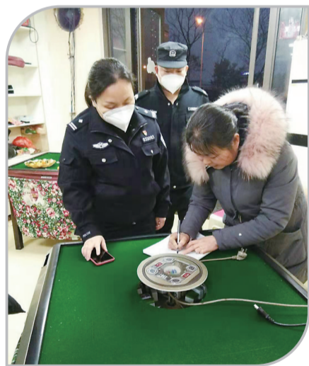
▲民警在麻将馆检查营业情况