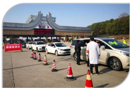
▲天元公安分局民警辅警在株洲西收费站设立检查卡点

在新型冠状病毒感染的肺炎疫情防控这个特殊“战场”上,天元分局各党支部迅速行动,广大党员民警、辅警纷纷挺身而出,主动请缨,以坚定的信心和昂扬的状态投入战斗。“党员民警护卫队”的动人故事一幕幕上演,鲜红的党旗在疫情防控一线高高飘扬。