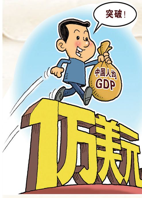
漫画:新的里程碑! 徐骏作

国家统计局17日发布数据,初步核算,2019年我国国内生产总值990865亿元,按可比价格计算,比上年增长6.1%,符合6%至6.5%的预期目标。分季度看,一季度同比增长6.4%,二季度增长6.2%,三季度增长6%,四季度增长6%。