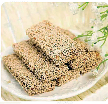
淦田药糖起源于明代,享盛誉于前清,历时四百多年而不衰