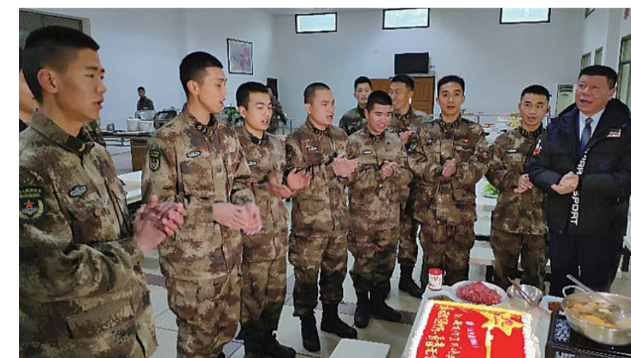
▲8名战士们集体过生日