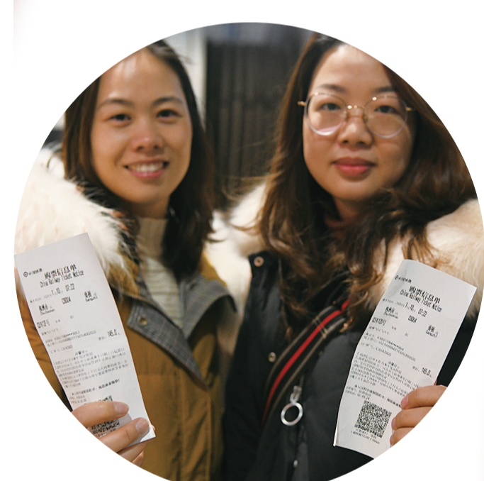
2020年春运首日,首发的C8004列车前,市民展示去往桑植县的电子客票。

春节将至,一年一度的春运已经拉开序幕。这场全球最大规模的人口迁徙,背后是中国人“回家过年”的朴素坚持。从过去的一票难求、几经辗转,到现在的飞机、高铁、普铁,或者是自驾,春运已经不再像过去那般紧张,人们回家过年的方式,也变得多种多样。这些变化里,隐藏的是社会经济的发展变迁。2020年春运,又能让我们看到哪些不一样?这些变化的背后,我们看到了哪些经济现象?