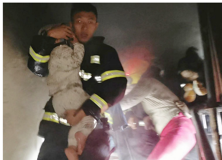
▲消防员成功将被困火场的幼童救出

1月12日清晨5时多,荷塘区芙蓉冲小区13栋504房的客厅突然起火,由于火势猛烈、浓烟密布,房内的谭女士只能抱着两岁女儿逃到阳台外檐,婆婆则被困在阳台内,三人随时都有生命危险。危急时刻,荷塘消防救援大队向阳救援站指战员及时赶到,将三人成功救出。