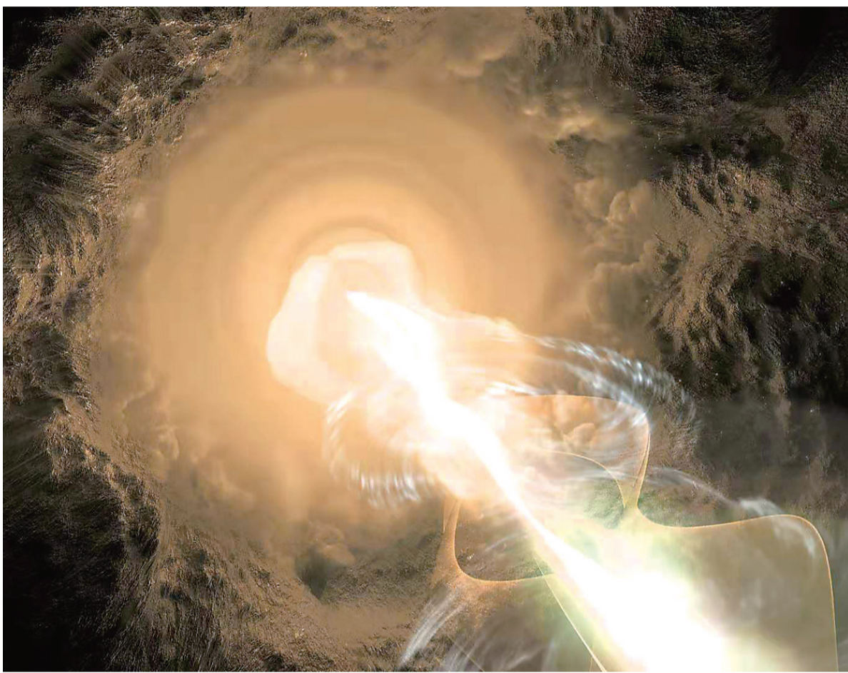
由中科院上海天文台安涛研究员领衔的中外天文学家团队,成功捕捉到宇宙中最遥远的耀变体的信号,并绘制出高分辨率图像(如图)。

专家们认为,耀变体对于研究高红移星系核心的吸积盘、超大质量黑洞、喷流三者之间的“共生共荣”关系以及它们所“居住”的星系环境,都具有极高价值。这一最新研究成果,推动了宇宙第一代发光天体和星系演化相关的前沿研究。