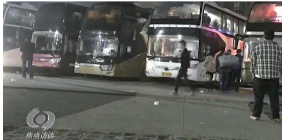
长途卧铺大巴车。据央视

每年一度的春运又开始了,不少人特别是在城里打工返乡的务工人员,选择乘坐长途客车出行。正常情况下,乘客可以在按规定设置的高速公路服务区休整,方便又舒适。 但据群众反映,有长途卧铺大巴车舍近求远,不在高速公路上的服务区停靠休息,非要开出高速公路到所谓的服务区停靠。这些所谓的服务区有什么特殊之处?