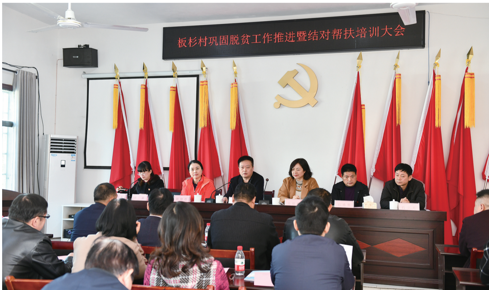
板杉村巩固脱贫工作推进暨结对帮扶培训大会现场。