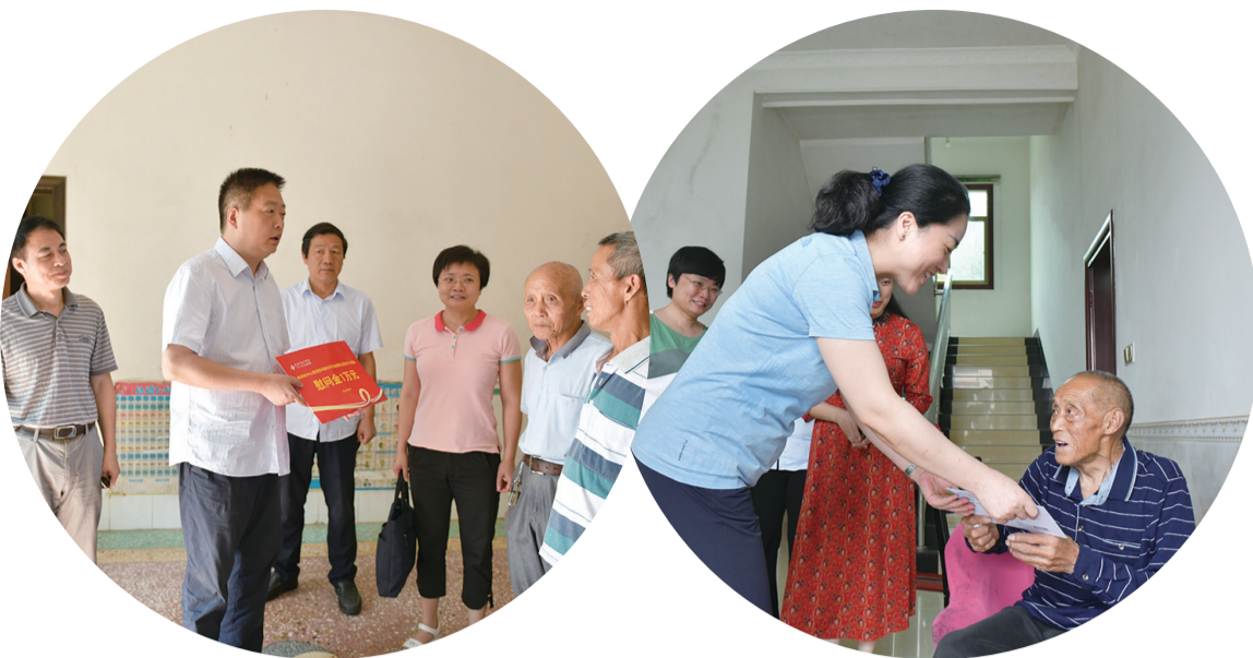
株洲市中心医院院长蔡安烈慰问白血病患者。

这离不开株洲市中心医院的倾情帮扶。2018年10月，该院作为株洲市派驻板杉村帮扶工作队队长单位，开启了对板杉村为期三年的精准帮扶。从党建到产业、从消费帮扶到健康扶贫，一年多时间，市中心医院尽锐出战，助推板杉村向着幸福出发。