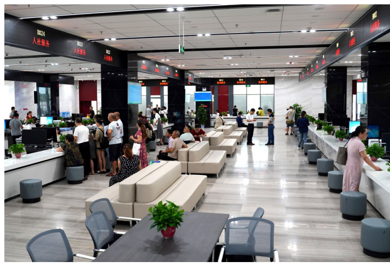
图为市民在醴陵市民中心服务大厅办事。

月,该市下发温暖企业“三百”行动(百家单位帮扶企业、百家企业成长计划、企业问题百日销号)实施方案,帮助扶持471家“四上”企业发展,对100家规模大、成长性好的重点企业实行“一名市级领导、一套成长计划、一个专门班子”帮扶,其余企业由100家单位安排精干力量组成工作组,开展一对一服务,协调解决企业发展中的重点难点问题,助力企业发展。截至目前,“三百”行动已进行四轮走访,该市市级领导和各单位负责人共走访企业1000余人次,办结问题208个。