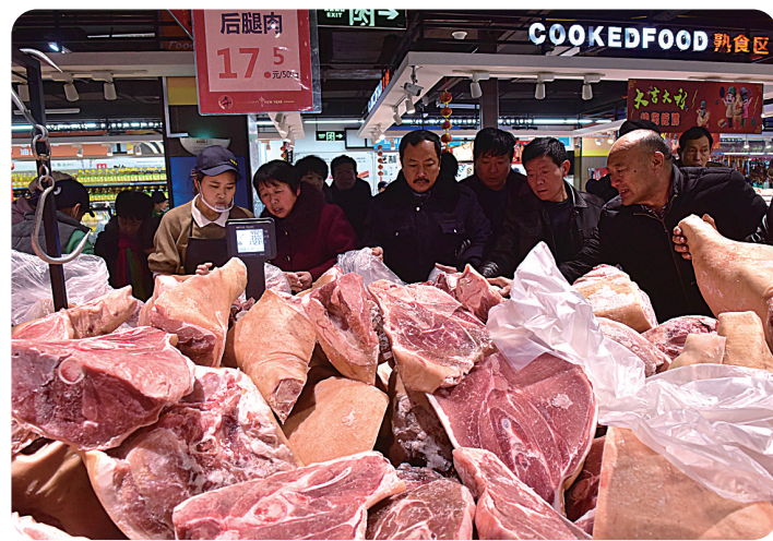
1月9日,市民在河北省新乐市一家超市选购猪肉。