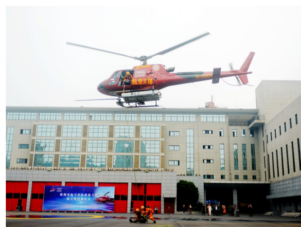
▲航空应急救援演练(资料图片)