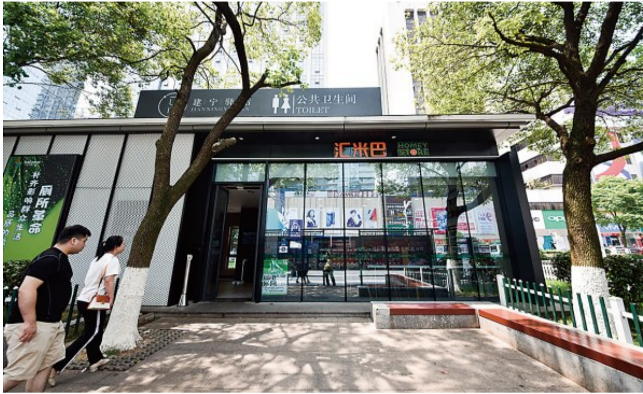
“建宁驿站”已然成为株洲街头一道靓丽的民生风景。

拓宽渠道、创新方式,增资源、解难题。2019年,我市多措并举,让少有所学,努力办人民满意的教育。 多措并举新增园、学位。城镇新增公办幼儿园园位 20850 个,公办园在园幼儿占比达 32.17%。普惠性幼儿园覆盖率达 75%。新改扩建中小学 39 所,新增学位 17126 个,天元白鹤溪学校、长郡云龙实验学校等建成开学。市属汽车工程职业学院、工业学校、幼师学校整体搬迁入职教城办学,湖南工业大学醴陵陶瓷学院建成开学。 综合施策化解大班额。全市共消除大班额 621 个,大班额比率从 2018 年底的 7.13% 降至 1.05%,石峰、云龙、渌口、炎陵、醴陵 5 个县区实现大班额“清零”。城区共接收符合条件的 73490 名随迁子女接受义务教育。在农村,175 所(含 48 个农村教学点)义务教育学校完成标准化建设,标准化率达 84.18%。 创新改革破解新难题。全面推行校内课后服务,构建“1+X”(1 是作业辅导,X 是音体美社团活动)服务项目,化解“三点半难题”,惠及 11.5 万多名学生,家长满意度超过 98%。首次实施民办学校招生制度改革,城区民办学校招生计划 15% 学位参与微机派位,向社会释放了优质教育资源。