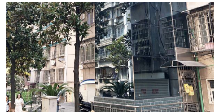
天元区园丁小区加装的电梯之一。

“建宁驿站”不仅能上厕所,还有母婴室给孩子喂奶,能休息,下雨天还提供雨伞,太贴心了。”易女士笑着说。 2019 年,我市继续推进“厕所革命”,建设“建宁驿站”,增加便民公共服务、便民商业板块,打造集如厕、休憩、便民服务、文化展示、商业经营等功能为一体的公共卫生服务综合体,多角度为市民提供“方便”。 2019 年,我市基本实现在城区新建驿站 200 座、改造公厕 200 座、开放公厕 200 座目标,而且城市建成区 500 米内有公厕,所有公厕有统一标识、有专人管理保洁、有手纸。 去年 11 月 20 日,新华社为株洲的“厕所革命”点赞,并用英语报道向全球推介株洲经验。去年 12 月,全国“厕所革命”株洲典型经验专题调研座谈会召开,人民日报社人民论坛调研专家组成员连连称赞,认为“‘厕所革命’的株洲样本,可能就是中国样本!” 工业城市株洲,因一项项独具特色的民生实事,再次吸引世人瞩目。