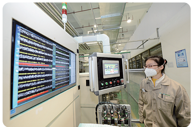
民营企业发展活力迸发,图为株洲岱勒新材企业车间。