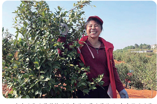
湖南天华油茶科技股份有限公司油茶林里,农户笑开了花。