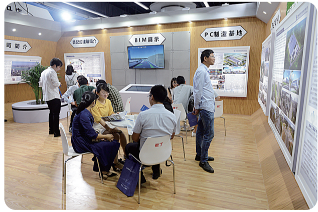
各区人才享受购房补贴政策统一。图为年轻人正在选购商品房。