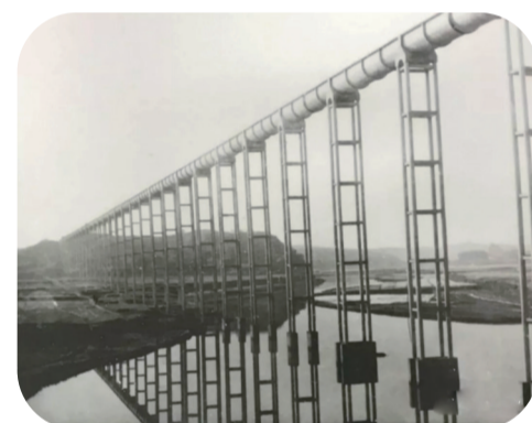
▲东干渠跃进渡槽建成投入使用(资料图片)