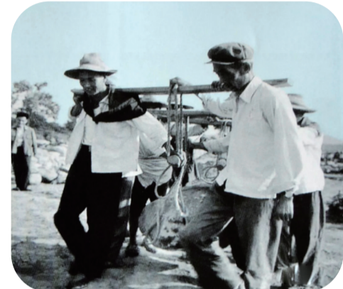
▲酒埠江水库建设场景(资料图片)