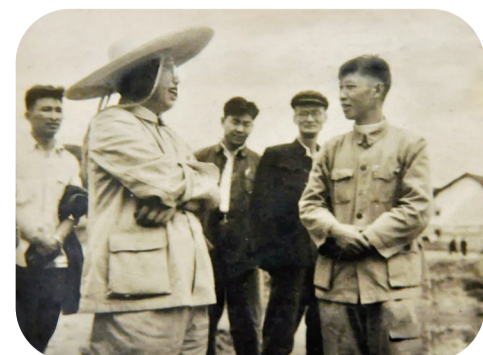
▲1959年5月,时任国务院副总理的谭震林亲临酒埠江水库建设工地视察(资料图片)

国务院、湖南省委、湘潭地区的领导经常来工地指导工作,攸县和醴陵县委全力以赴支持工程建设,最紧张的施工阶段,攸县县委机关搬到了工地办公。党和国家领导人谭震林、公安部部长罗瑞卿、农业部部长廖鲁言、省委书记张平化等领导同志先后来工地视察。谭震林同志更是关心家乡攸县建设事业,他对该工程的设计、规划和施工方案都倾注了极大的心血。直到1983年临终前还留下了将部分骨灰撒到酒埠江水库的遗言。