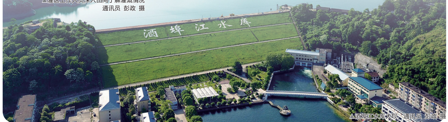
▲酒埠江水库大坝