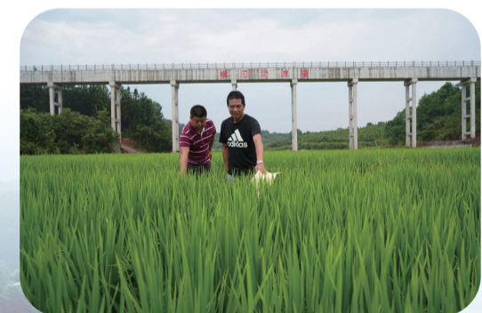
▲灌区工作人员深入田间了解灌溉情况