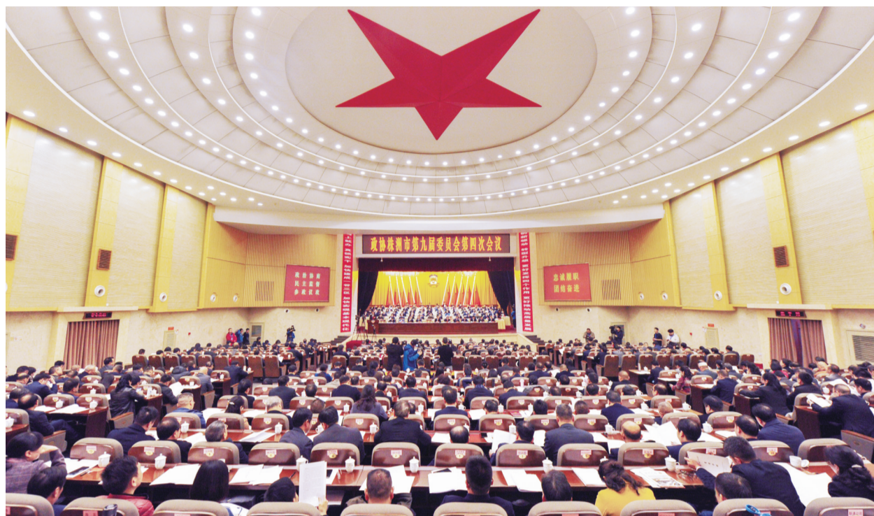
▲政协株洲市第九届委员会第四次全体会议昨日开幕

市政协主席蔡溪代表政协株洲市第九届委员会常务委员会作工作报告。蔡溪强调,过去的一年,市政协坚持以习近平新时代中国特色社会主义思想为指引,在中共株洲市委的坚强领导下,紧紧围绕我市“两个加快”——加快建成“一谷三区”,加快实现基本现代化,牢牢把握团结民主主题,着力创新履职方式方法,努力建设责任政协、务实政协、活力政协、忠诚履职、团结奋进,为加快建设富强美丽幸福新株洲注入了政协力量。一是致力凝聚共识,牢牢把握正确政治方向。深化理论学习,加强党的建设,扎实开展“不忘初心、牢记使命”主题教育,切实增强“四个意识”、坚定“四个自信”、做到“两个维护”。二是致力凝聚智慧,不断提高参政建言水平。紧扣全市发展中的重大问题,深入调查研究,积极协商议政,助推高质量发展、助推发展环境优化、助推教育事业发展、助推推进环境优化、助推教育事业发展、助推推进环境优化、助推教育事业发展。