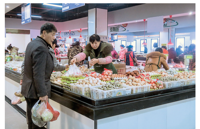
石峰区一处新改造后重新开业的农贸市场。