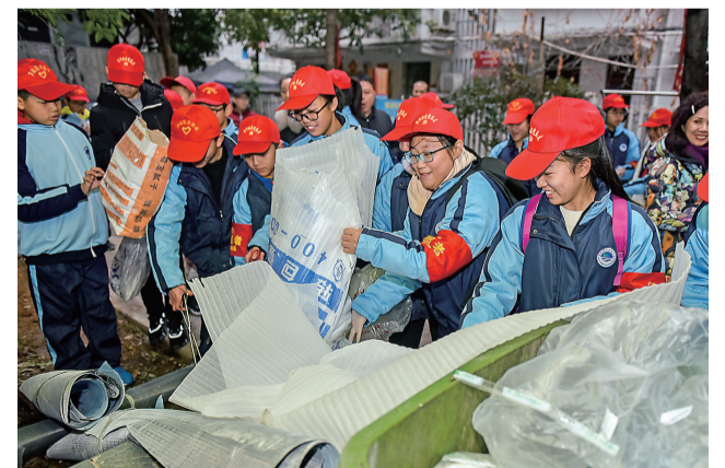
建宁实验中学志愿者和芦淞区沿河社区携手,清理社区里的垃圾。