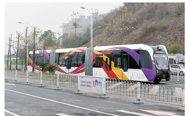
智轨列车在运行中。

去年两会期间,侨联界别提交了《关于进一步解决我市农贸市场难点问题的建议》。该提案提出,将农贸市场升级改造作为市政府为民办实事的重要工程之一,明确责任和任务,确保建设任务保质保量完成;积极引导吸纳社会资本进入,吸引有实力的大企业参与市场升级改造;食药部门加大对农贸市场产品抽检的力度,加强市民对农贸市场的信心;以商户导向、消费者为导向,讲究体验式消费,实现农贸市场品牌化、标准化管理的现代化。