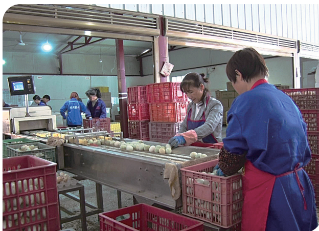
银丹农产品有限公司带动贫困户就业。