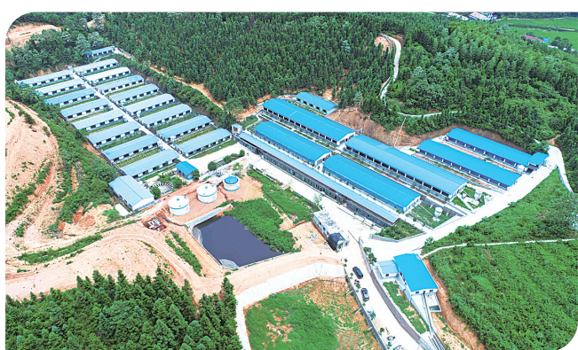
龙头企业明扬农牧。

产业选准了,沉睡的资源也能被盘活。在市、区及驻村工作队的支持下,村里道路硬化加宽,水利设施除险加固,通讯信号实现全覆盖,还建起了60千瓦光伏发电站,村集体每年可借此增收5万元。基础设施的改善,不仅方便了村民的生产生活,也为发展致富产业提供了更多可能。2016年,村里引进株洲华利生态农牧发展有限公司,精心编制户外休闲旅游产业规划,打造“十里长廊、百丈瀑布、千米君山、万亩竹林”等景点。一些村民抓住时机办起了农家乐,村里还依据季节更替设置了不同的旅游休闲活动,春季可以挖春笋、登高,看映山红,夏季可以游泳、溯溪,秋季可以露营、烧烤,做柴火饭,冬季可以挖冬笋、烤柴火、喝