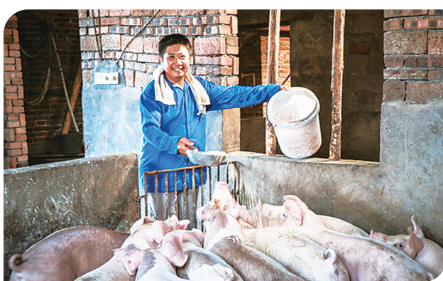
贫困户通过发展养殖业增收。