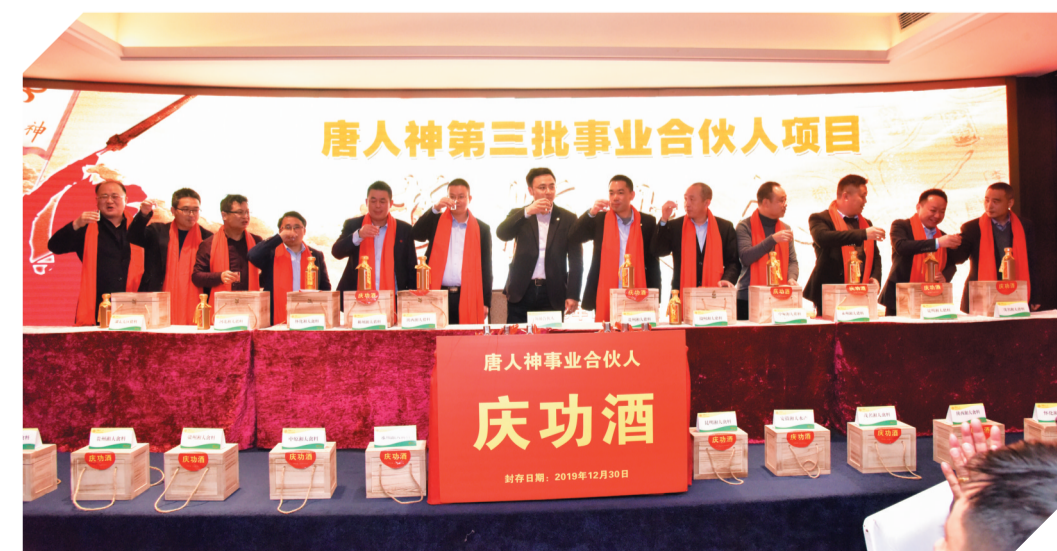
▲唐人神第三批事业合伙人项目庆功宴现场

岁月易老,初心不改;一万年太久,只争朝夕。唐人神在陶一山的带领下,在这充满希望的春天就要来临之际,问君能有多愁?一江春水向东流,长风破浪会有时,直挂云帆济沧海!(高梦)