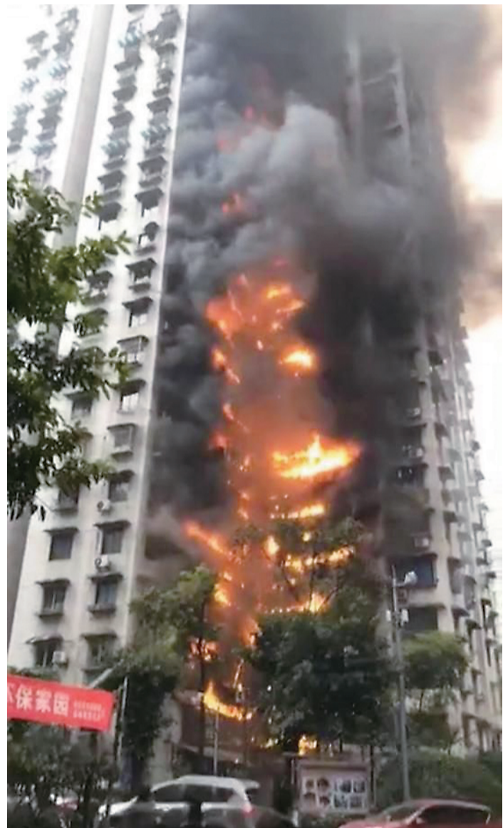
▲重庆市一栋高层居民楼发生火灾(视频截图)

近期,辽宁沈阳、重庆高层住宅先后发生火灾事故,消防安全警钟接连敲响,这两起火灾也刷爆了朋友圈,引发社会广泛的关注与担心。那么,高层住宅发生火灾后,该如何逃生?