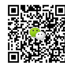
扫一扫上图中二维码征集,当有惊喜