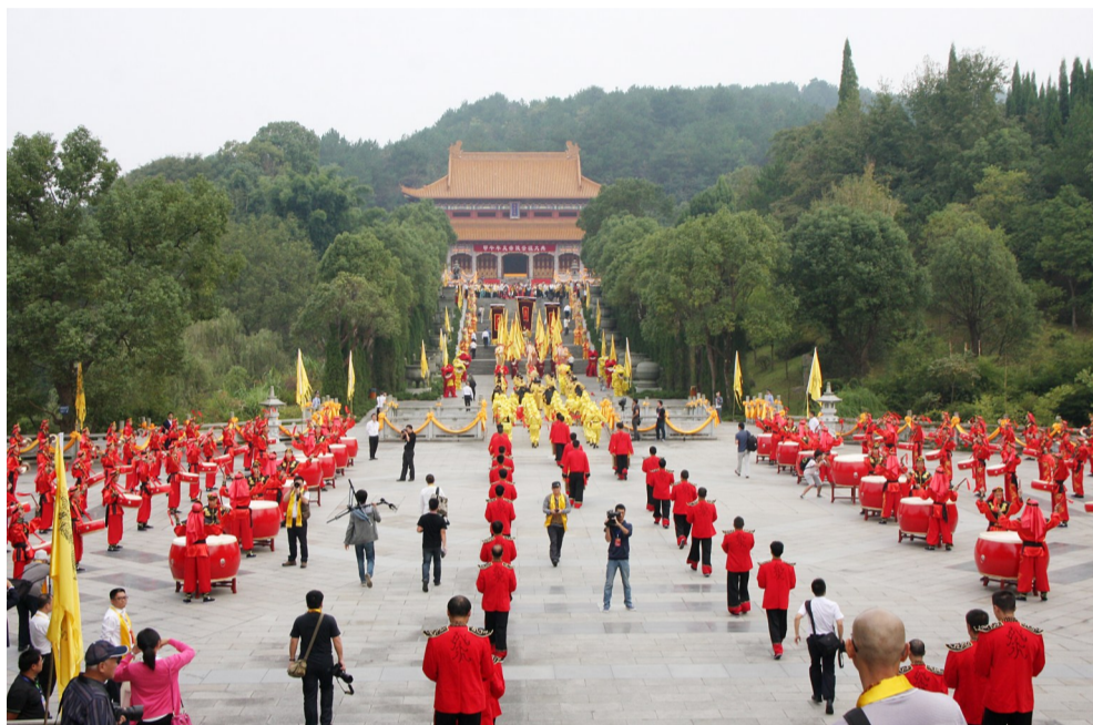
▲炎帝陵祭祖大典(资料图)

说起炎帝陵,你可能会想到恢弘的大殿和高大的石雕。但是游玩过后,你能带来的恐怕只有记忆。对此,政协民建市委界别在去年两会期间提出《推进文旅深度融合的建议》,建议我市将丰富的文化资源变成可感受、可体验、可消费的旅游产品。