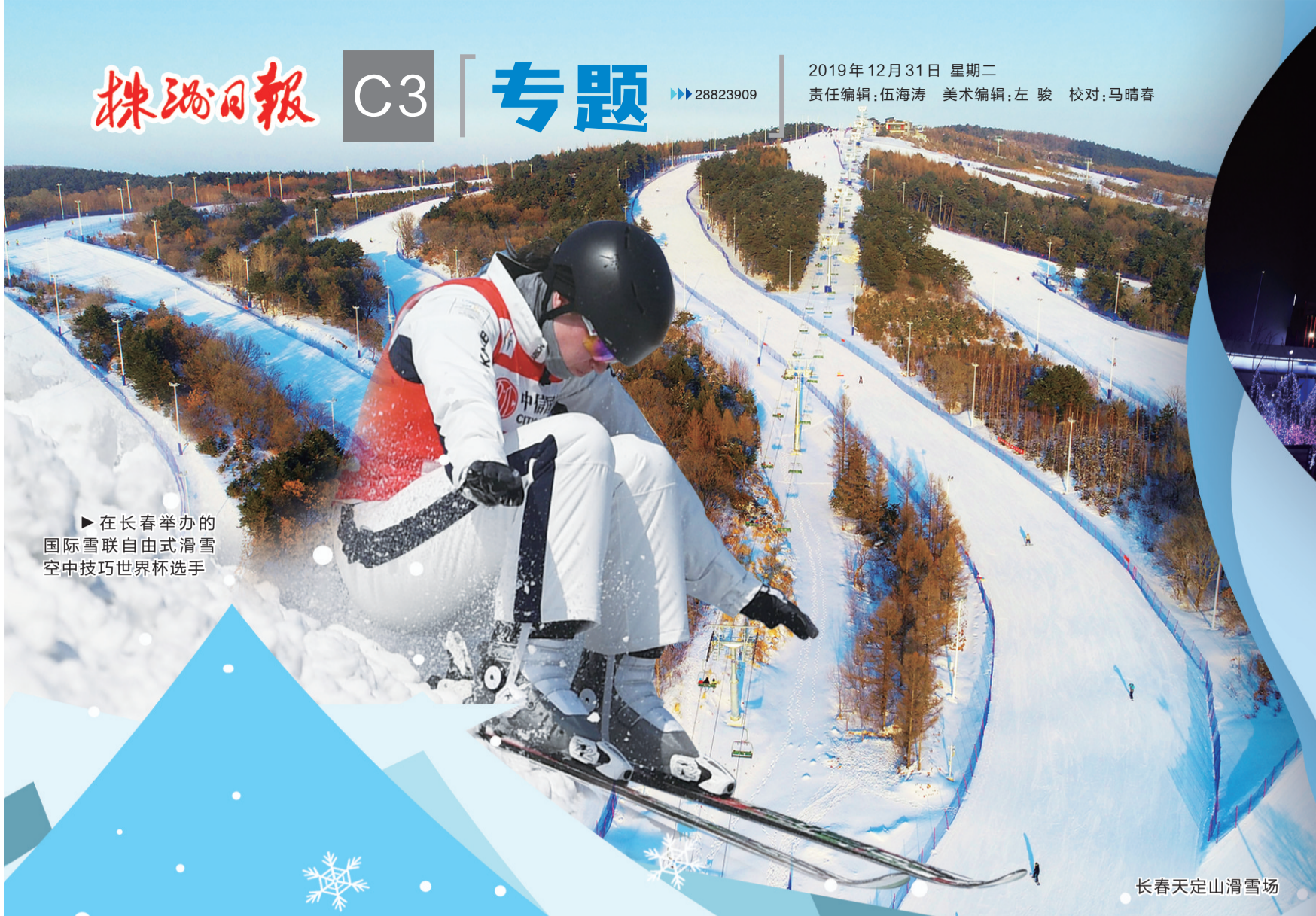
▶在长春举办的国际雪联自由式滑雪空中技巧世界杯选手