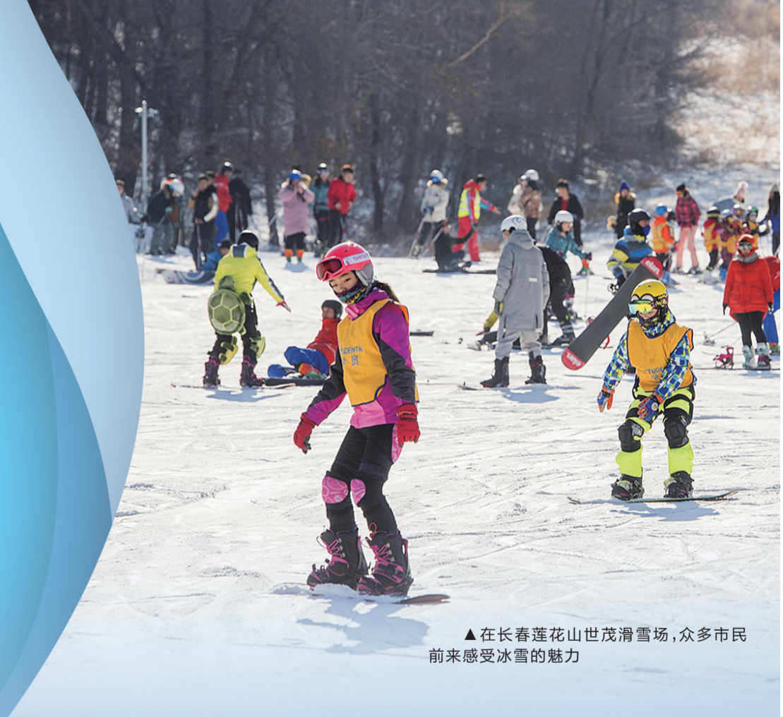
▲在长春莲花山世茂滑雪场,众多市民前来感受冰雪的魅力