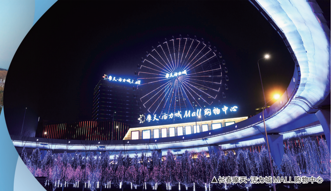
△长春摩泰·活力城MALL购物中心