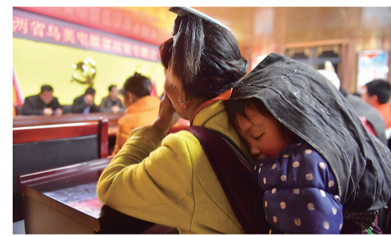
一名妇女背着小孩参加乌英苗寨脱贫产业会议(3月14日摄)。

乌英苗寨位于桂黔交界的大苗山深处,共有140户600多人,其中100户属广西柳州市融水苗族自治县村洞乡尧塘村,40户属贵州省从江县翠里瑶族壮族乡南岑村。这里交通不便,土地资源匮乏,自然环境恶劣,曾经是一个极度贫困的苗寨。一年来,全寨共有44户贫困户实现脱贫,贫困户已从2016年的92户减少到目前的4户。