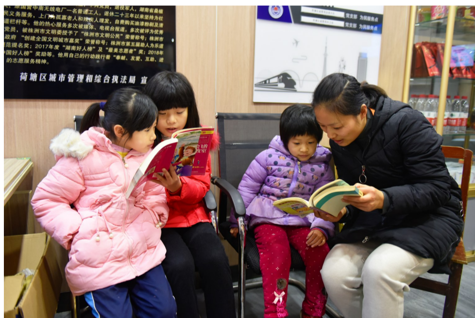
袁家湾社区建宁驿站:驿站里的临时托儿所,社区工作人员带孩子们一起读书。