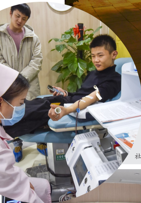
清石广场建宁驿站:驿站里的献血屋,热血在此采集,爱心流向社会。