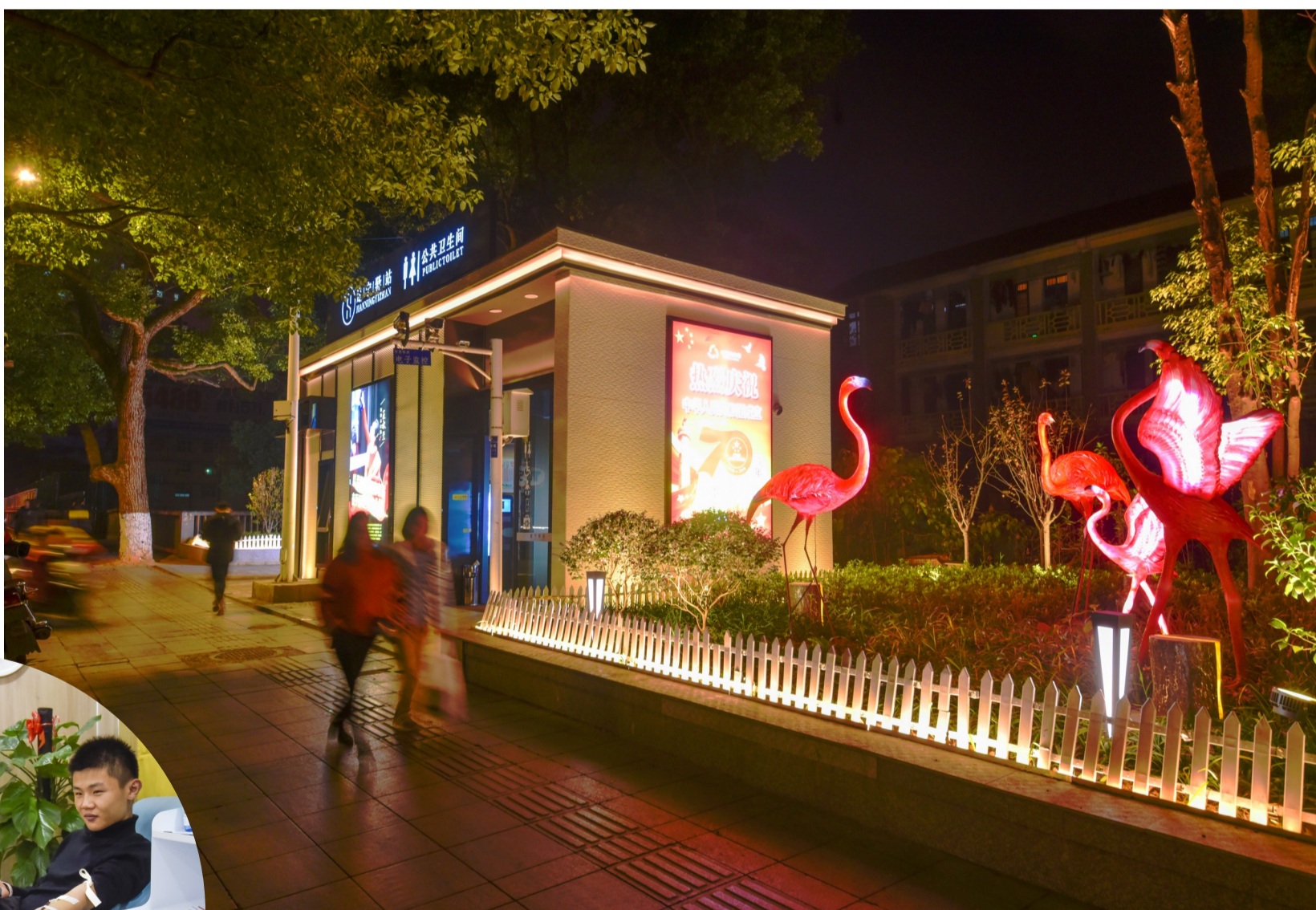
新华桥桥头建宁驿站:我市首个“微亮化”项目,4只粉色“火烈鸟”的立体LED灯饰照亮了驿站,也扮美了城市。