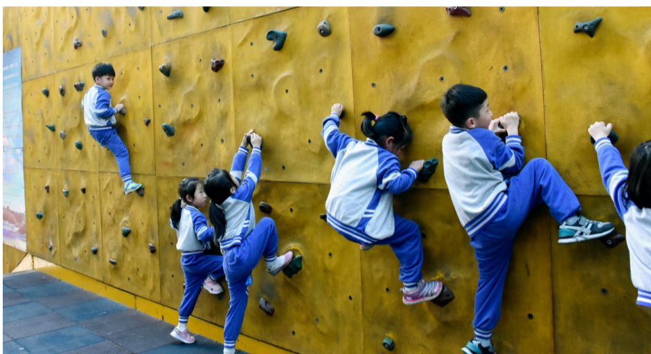
在九方小学,每到休息时间,孩子们便利用攀岩墙来锻炼身体。