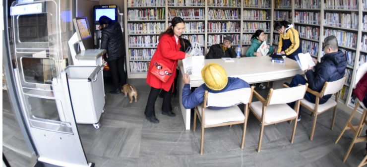
清水塘广场建宁驿站:周末,附近居民纷纷来到驿站的24小时书屋看书休憩。