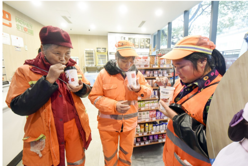
中心广场建宁驿站:几位环卫工人在此喝着热水,躲避冬日风雨。