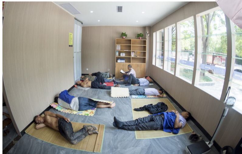
黄河南路建宁驿站:盛夏中午,几位附近工地的农民工,在凉爽的驿站里做短时休息。