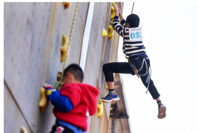
攀岩要学会灵活正确的运用各种腿脚动作,也就是俗称的找好支点。