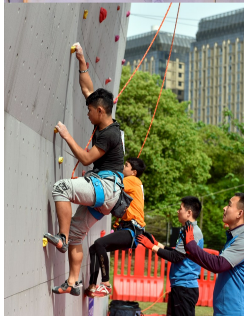
在攀岩训练和比赛中,保护者利用主绳、安全带等保护装备,在攀岩的全过程中给攀岩者提供安全的保护。