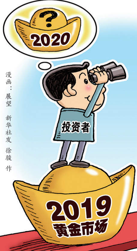
漫画:展望 徐骏作

2019年,黄金市场一举打破僵局。此前,国际金价已连续两年展开震荡盘整,而一进入2019年,金价就迎来一轮冲高回落,但随着美联储降息,以及随后不少央行先后加入宽松货币“阵营”,金价再次冲击6年来的新高。 统计显示,国际金价今年以来已累计上涨超过15%,创下了2011年来的最大年度涨幅。而以人民币计价的黄金价格涨幅更大,其中上海期货交易所上市的黄金期货价格年内累计涨幅达16.5%,是三年来最大的年度涨幅。