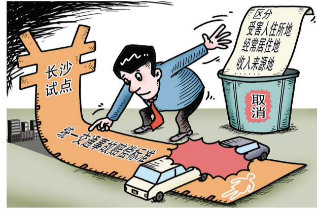
漫画:一视同仁 新华社发 刘道伟作

记者22日从湖南长沙市中级人民法院获悉,长沙市两级法院将机动车交通事故责任纠纷案件中统一适用城镇居民赔偿标准。根据上级批复精神,长沙市中级人民法院规定,机动车交通事故责任纠纷案件中不再区分受害人住所地或经常居住地、收入来源地等因素,其残疾赔偿金、死亡赔偿金统一按照湖南省上一年度城镇居民人均可支配收入标准计算。机动车交通事故责任纠纷案件中被扶养人生活费统一按照湖南省上一年度城镇居民人均消费性支出标准计算。根据试点方案,自12月20日起,长沙市两级法院新受理的机动车交通事故责任纠纷一审案件统一适用城镇居民人身损害赔偿标准。 业内人士认为,在机动车交通事故责任纠纷案件中,统一适用城镇居民赔偿标准,有利于平等保护城乡居民权利。