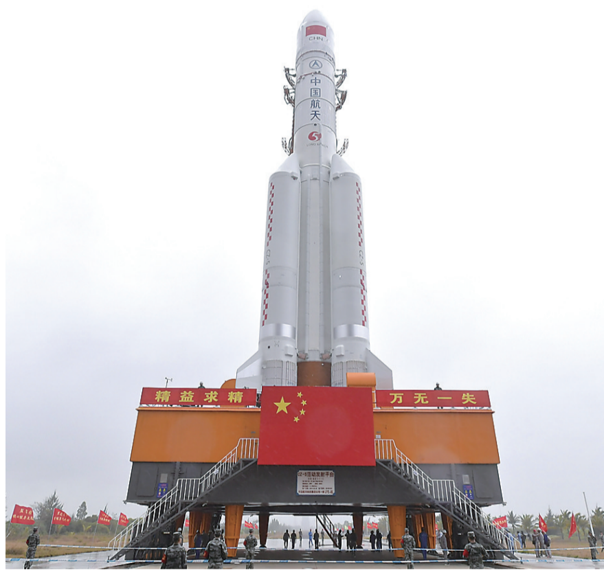
12月21日，长征五号遥三运载火箭在中国文昌航天发射场完成技术区相关工作后，垂直转运至发射区。

新华社北京12月21日电 记者从国家航天局获悉，12月21日，长征五号遥三运载火箭在中国文昌航天发射场完成技术区相关工作后，垂直转运至发射区，计划于12月底前择机实施飞行试验任务。