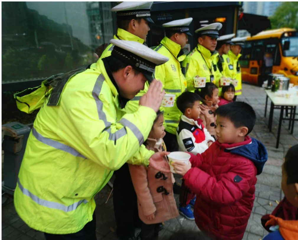
连日来,气温骤降,天气寒冷,交警们冒着严寒坚守在各自的岗位上。12月18日,三之三湘水湾幼儿园的小朋友在老师的带领下,来到交警值班岗亭、保安室,为交警叔叔们送上了一碗碗热乎乎