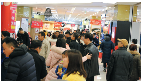
▲株百是株洲人购物的天堂

60多年路途漫漫,株百始终坚守初心,以满满的诚心与福利回馈广大客户的支持。这不,12月20-25日,株百年终答谢,全城向“百”,14家门店联动,压轴钜惠,比如生活超市,不仅有答谢惠顾礼,部分商品更是低至5折;家用、生活电器,更是在12月20-22日推出幸运赢免单的活动,彩电、空调、冰箱等商品可全网比价,全城比价,保价30天,买贵退差;优雅名媛馆,年