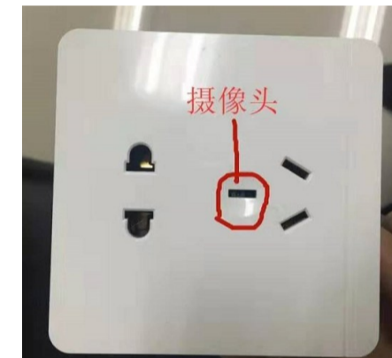
▲攸县警方查获的针孔摄像头

经查,自2017年以来,以上人员在经营正规安防产品的同时,发现常有人过来询问针孔摄像头的相关情况。在明知销售针孔摄像头是违法行为的前提下,他们为