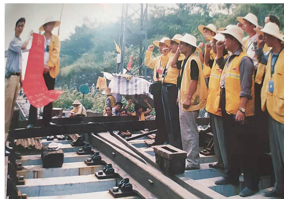
▲株洲提速“大会战”施工现场

1957年秋,我出生在距株洲火车站以东2公里的朱田铺铁路边。上世纪七十年代中期,我上山下乡当知青。1977年顶父之职进原株洲铁路工务段株洲养路二工区,从此开始了与株洲火车站长达40年的不解之缘。