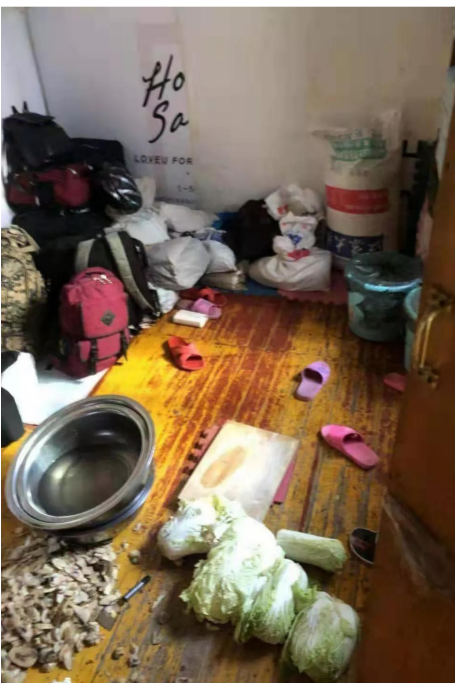
▲窝点内十分脏乱,堆放着大量白菜