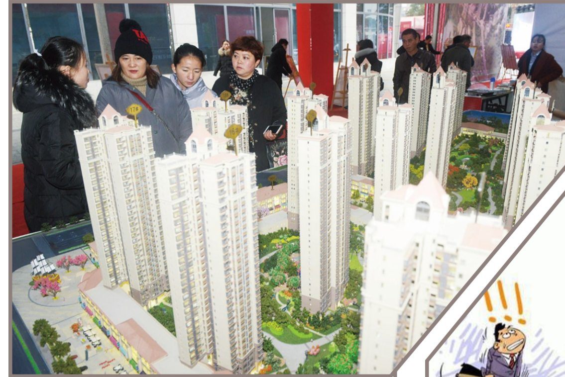
▲市民正在看房询价