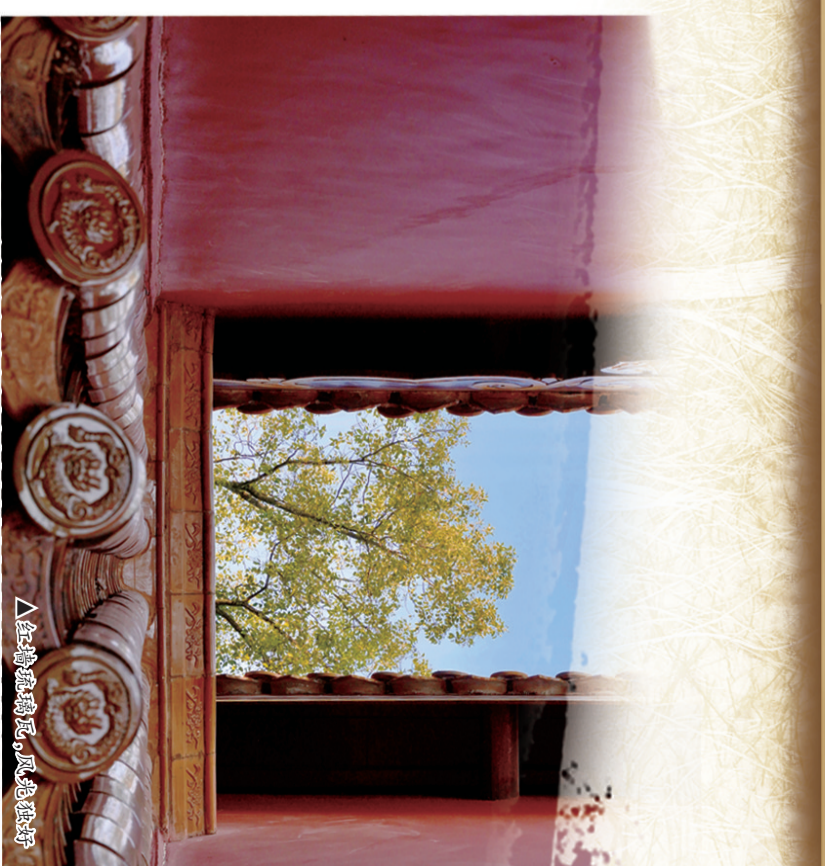
△红墙黛瓦,风光正好