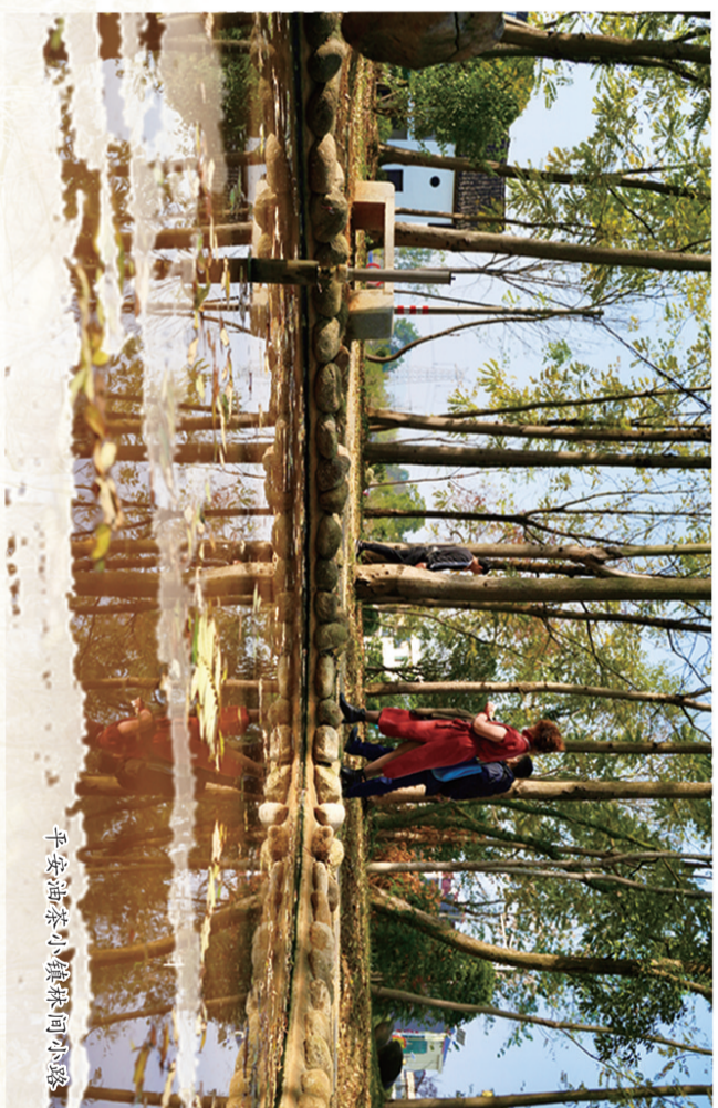
平安油茶小镇的一间古香古色的山中木屋