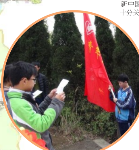
罗哲烈士墓。