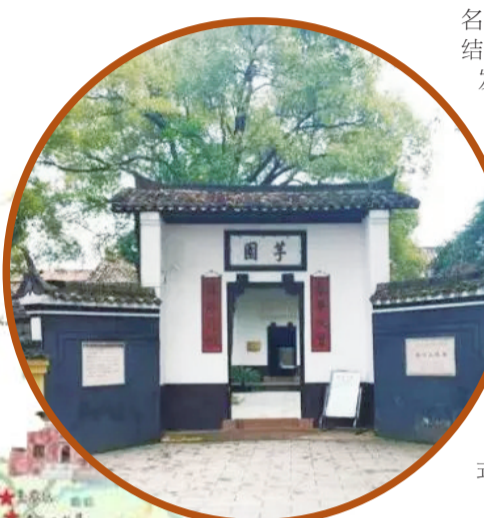
李立三故居。株洲日报记者 成建梅 供图