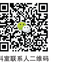
科室联系人二维码

门诊：省直中医院门诊二楼14室 坐诊时间：周一全天 电话：28290273 28290272