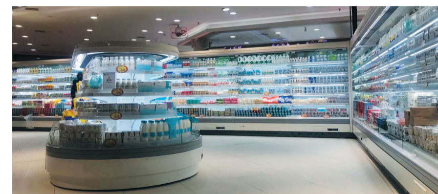
▲各类商品整齐地摆放在崭新的柜台上,静候挑选