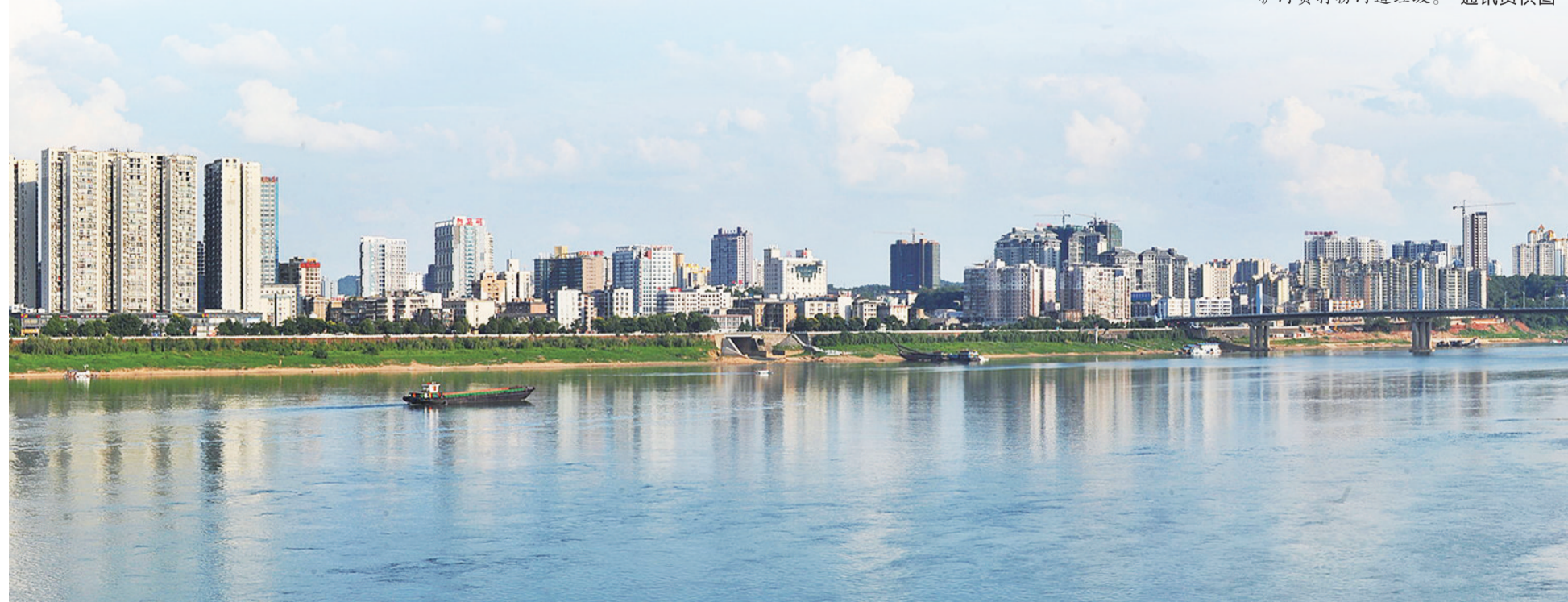
湘江芦淞段 谭清云 摄