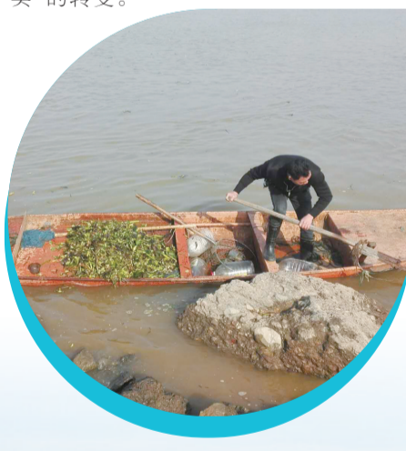
护河员打捞河道垃圾。

C “科技+河长”：管河有效 芦淞区河长办就立即组织处置，并通过无人机拍摄高清照片留样以及影像对比，结合同期水质监测数据，精准掌握区域水质动态。 无人机巡河的主要任务是对芦淞区湘江、枫溪港、大京水库等14条区级“河长制”管理的河流(水库)开展日常巡查，每月巡河2次以上，每次飞行10公里，其航拍影像，将作为“一河一档”基础数据。至今年年底，全区14条河流(水库)都将有来自“天眼”提供的信息。 芦淞区河长办负责人介绍，目前正试点建设“智慧河流”，布局在线视频监控系統，完善集水库水质监测自动预警、巡河信息记录、河库数字档案、监督检查考核、河流水域岸线保护管理等于一体的信息化系统，真正实现无盲区治水。 今年以来，该区还针对河长制运行不规范等问题，创新工作方法，利用短信平台建立提醒机制，既补齐了APP巡河任务交办下去不能主动提醒责任人的短板，也及时推送群众投诉、突发问题给责任河长，实现河长“有名”到“有实”的转变。