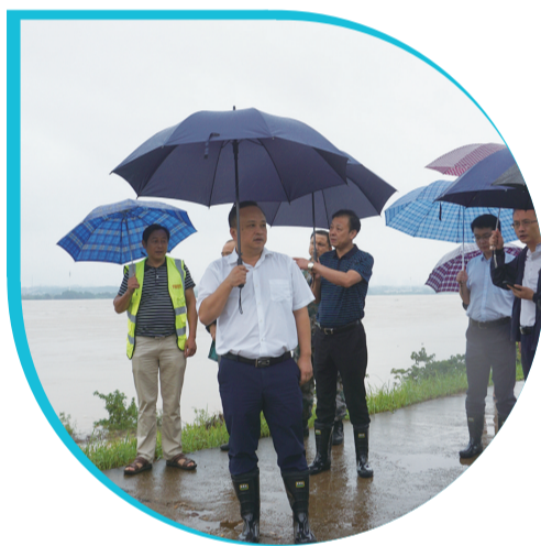
芦淞区委副书记、区长、区总河长杨晓江督查湘江。

A “党建+河长制”：护河有力 12月2日，王建勇带队巡查湘江庆云段。这是他每月的例行巡河。 清澈湘水如一条碧绿的丝带，系在城市腰间。巡河不是走马观花，而是带着问题，发现问题，解决问题。王建勇打开手机“河长APP”打卡巡河，记录出行线路，并现场交办发现的问题，带头落实河长制工作。 湘江芦淞段有16.59公里，加之枫溪港、建宁港、白石港，构成芦淞区境内“一江三港”的河湖轮廓。全市5区中，芦淞区的河网流域面积相对较大，还包括中型水库1座、小二型水库14座、山塘3842处、小型灌溉泵站5座、骨干灌溉水渠道60.25千米、渠系建筑物195处，因此工作任务显得很重。 让大河小水有人管。该区区委、区政府14位领导任全区10条河道和4座水库区级河长，河流(水库)所经镇(街道)24位党政领导担任镇级河长；河流、水库所经村(社区)65位负责人担任村级河长，实现所有河流、重点水库三级河长全覆盖。 芦淞区委副书记、区长、区总河长杨晓江督查湘江河道时强调：“区里各级河长要切实履责，提高政治站位，强化工作举措，务求工作实效，以河长制推动河长治。” 把党旗插到第一线。该区采用“党建+河长制”模式，充分发挥广大党员先锋模范作用，建起了一支勇于与河湖污染作斗争的环保铁军。各级河长站位高，区级河长月巡、乡级河长旬巡、村级河长周巡，层层压紧压实河长责任。以问题导向，通过巡河APP、交办函、现场交办，按照“一单四制”要求，狠抓河湖生态综合治理，河长制湖长制工作有力推进。