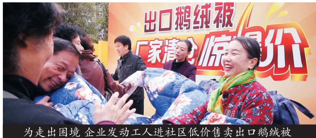
为走出困境 企业发动工人进社区低价售卖出口鹅绒被

对于本次甩卖活动,邢总介绍道,因为成本高昂,这次活动只销售一万条,一万条售完立即恢复原价,绝不再追加。利用这个时间,我们现在也在和国内的经销商在接触洽谈,一旦国内大商场的销售渠道打开,我们就马上恢复正常销售。同时也借这次清仓活动,打响口碑,更好的开拓国内市场。