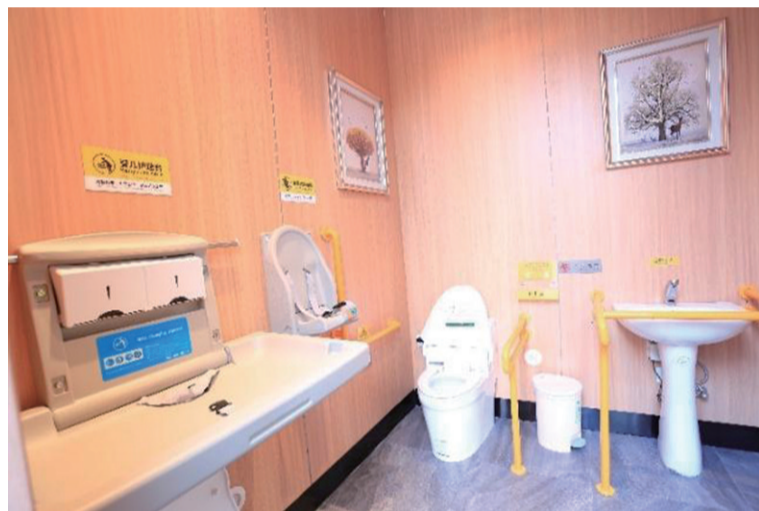
▲“建宁驿站”的第三卫生间,各类设施齐全(资料图)