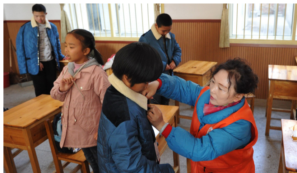
志愿者给孩子们带来了新衣服。