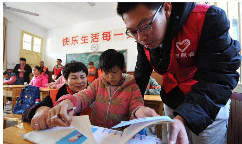
志愿者在课堂上辅导作画。