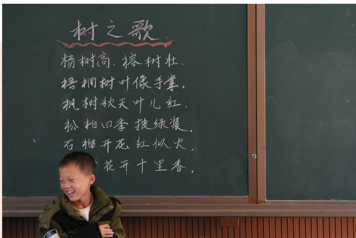
上台朗诵完一首诗,他获得了满场的掌声。