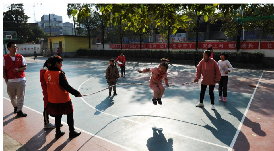
课间休息,球场上满是孩子们的欢声笑语。