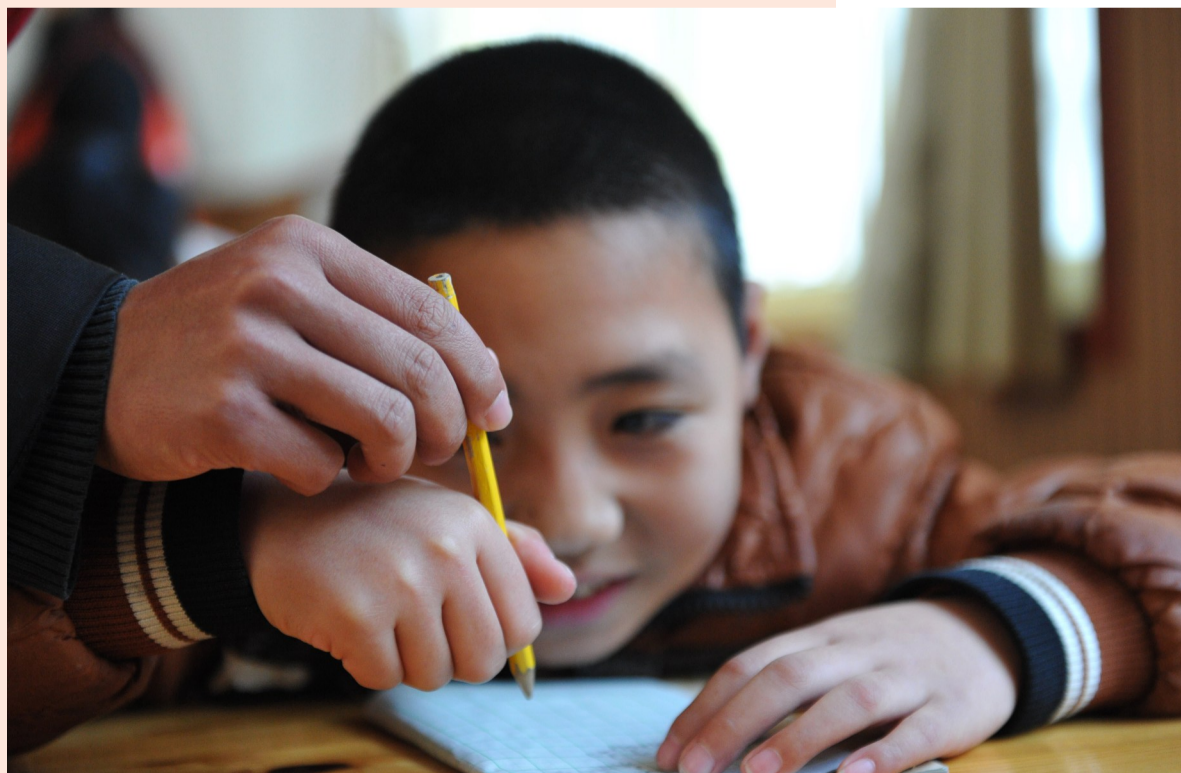
从持笔,到一笔一划地书写,对老师和孩子来说都不是容易的事。