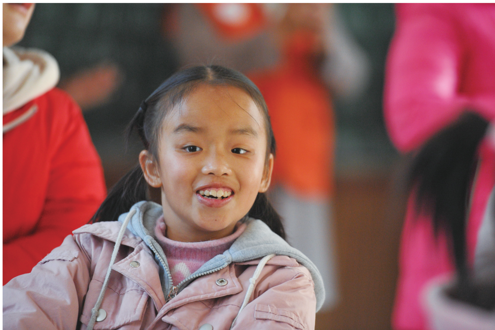
孩子的笑容是对志愿者们最好的回报。