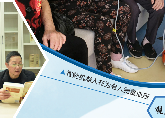
智能机器人在为老人测量血压