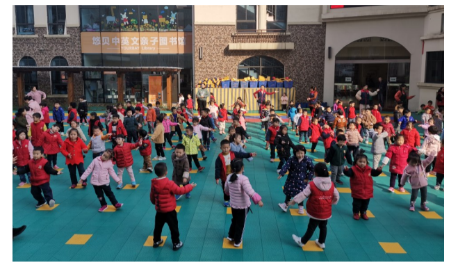
▲孩子们正在做课间操