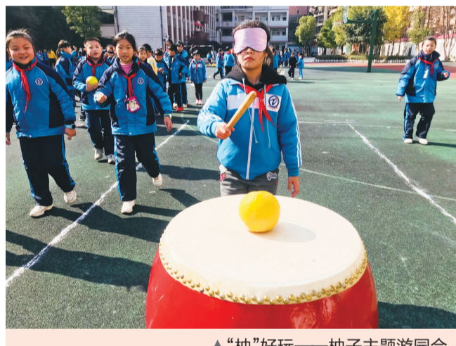
▲“柚”好玩——柚子主题游园会