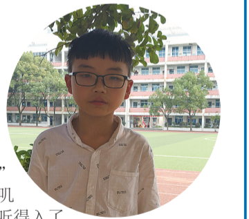
有生命一样被她呵护着,最后她开心地地望着红旗笑了。“无论我走到哪里,都流出一首赞歌……”刚才那面红旗又有节奏地摇摆起来,汇入了一片红海中。我转过头,与同学四目相视,灿烂地笑开了。