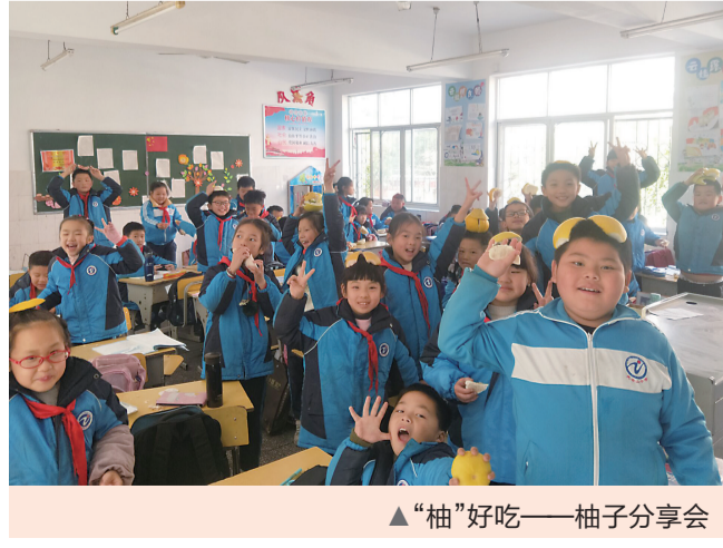
▲“柚”好吃——柚子分享会