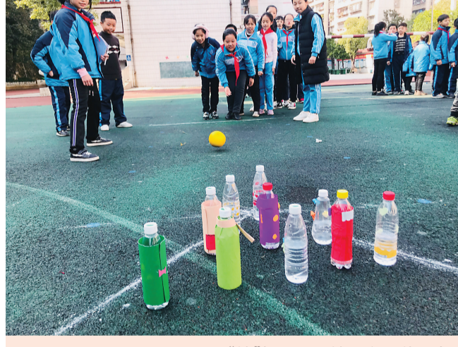
▲“柚”好玩——柚子主题游园会