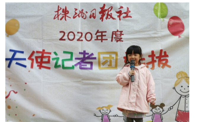
▲2020年度株洲日报社天使记者团选拔进行中