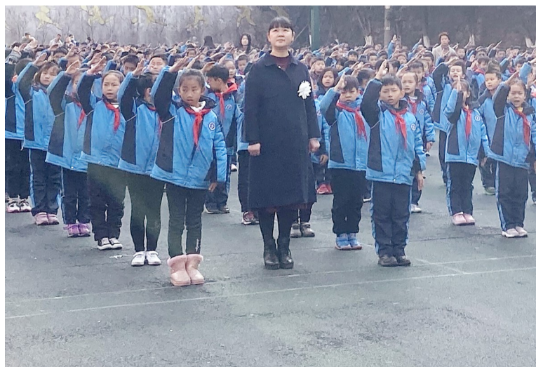
▲庆云山小学国家公祭日仪式现场

少先队员代表身着黑色服装、左胸佩戴小白花,将亲手制作的和平卡贴上了“红领巾许愿和平墙”。12月13日,芦淞区庆云山小学举行南京大屠杀死难者国家公祭日活动。