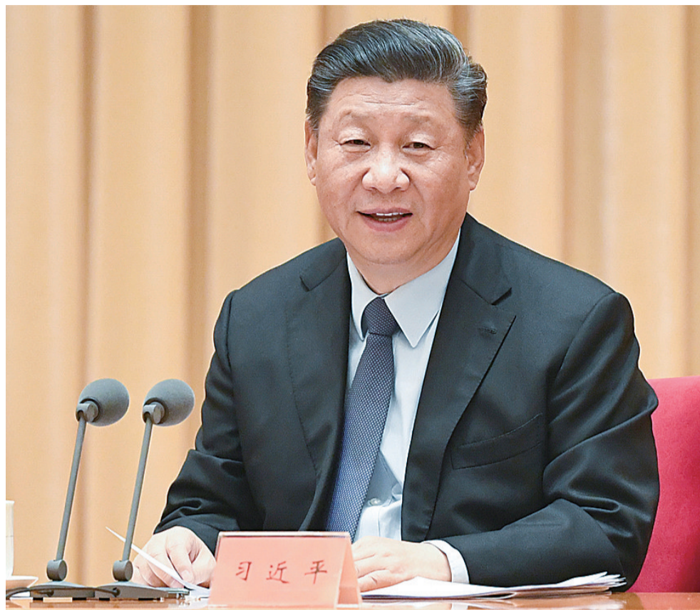
▲习近平在中央经济工作会议上发表重要讲话

要发挥政府作用保基本,注重普惠性、基础性、兜底性,做好关键时点、困难人群的基本生活保障。要稳定就业总量,改善就业结构,提升就业质量,突出抓好重点群体就业工作,确保零就业家庭动态清零。要加快补齐民生短板,有效解决进城务工人员子女上学难问题。要兜住基本生活底线,确保养老金按时足额发放,加快推进养老保险全国统筹。要发挥市场供给灵活性优势,深化医疗养老等民生服务领域市场化改革和对内对外开放,增强多层次多样化供给能力,更好实现社会效益和经济效益相统一。要加大城市困难群众住房保障工作,加强城市更新和存量住房改造提升,做好城镇老旧小区改造,大力发展租赁住房。要坚持房子是用来住的、不是用来炒的定位,全面落实因城施策,稳地价、稳房价、稳预期的长效管理调控机制,促进房地产市场平稳健康发展。