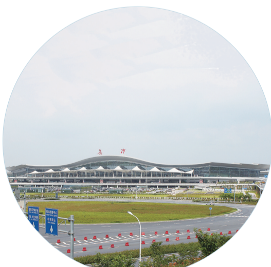
▲ 长沙黄花国际机场新航站楼及高架桥(鲁班奖)