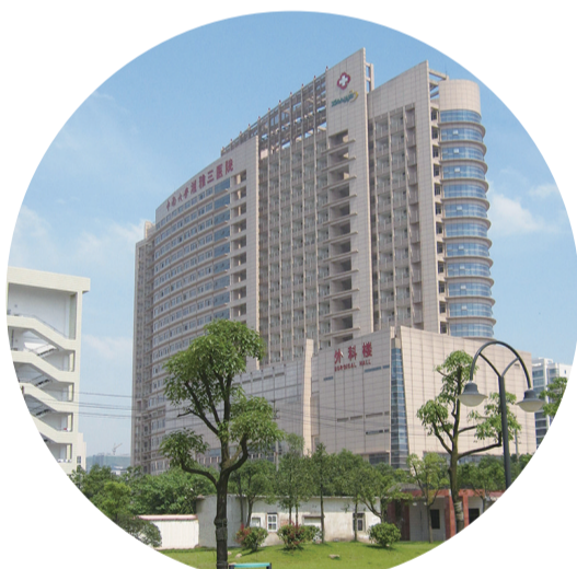
▲ 中南大学湘雅三医院外科病房楼(鲁班奖)