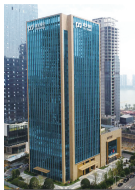
省建设工程芙蓉奖、湖南省优质工程、湖南省绿色施工工程、长沙市优质结构工程。

上海浦东发展银行股份有限公司长沙分行办公大楼,坐落在美丽的湘江之畔,位于长沙湘江新区金融区之中,是一座智能化、节能型、具有高度景观展示性、空间连续性、公众归属感的现代化办公大楼。本工程建筑地下3层,地上23层,项目总占地面积7628.53m 2 ,总建筑面积约51314.66m 2 。项目于2015年3月6日开工,2017年5月8日竣工验收。项目获评中国建设工程鲁班奖、全国建筑业绿色施工示范工程、中国建筑工程装饰奖、湖南省建设工程芙蓉奖、湖南省优质工程、湖南省绿色施工工程、长沙市优质结构工程。