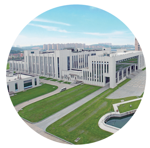
▲ 南岳生物制药产业园建安工程(鲁班奖)