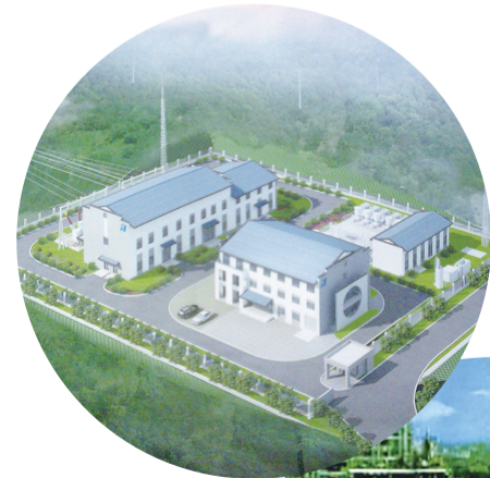
▲ 苏宝顶风电项目(国优)