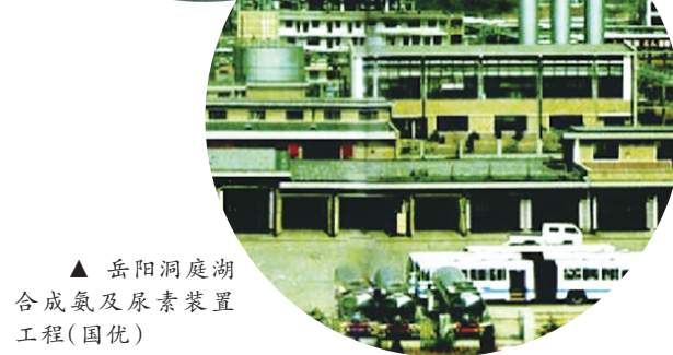
▲ 岳阳洞庭湖合成氨及尿素装置工程(国优)