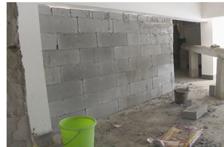
▲转换层砌上了水泥砖