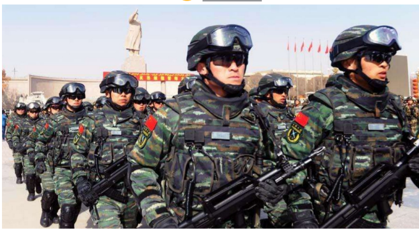
资料图:新疆反恐誓师大会。