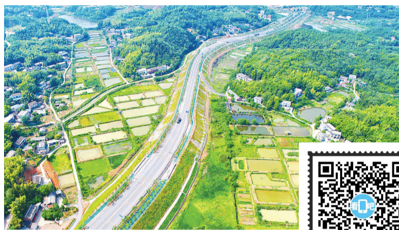
航拍石峰区环保大道。