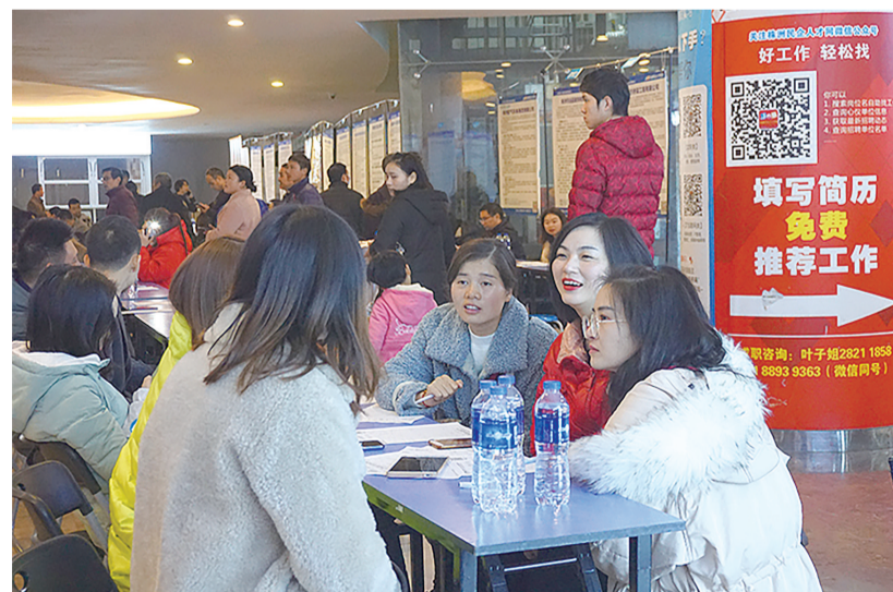
招聘会现场人气旺。

渌口区人社局相关负责人介绍,促进贫困劳动力就业,助推脱贫攻坚工作,该区出台政策,按吸纳贫困劳动力就业人数给予企业社保补贴、岗位补贴及一次性政策奖补。同时,积极开展就业扶贫基地创建工作,截至目前,共有就业扶贫基地13家,其中省级3家,市级2家,吸纳135名贫困劳动力就业。