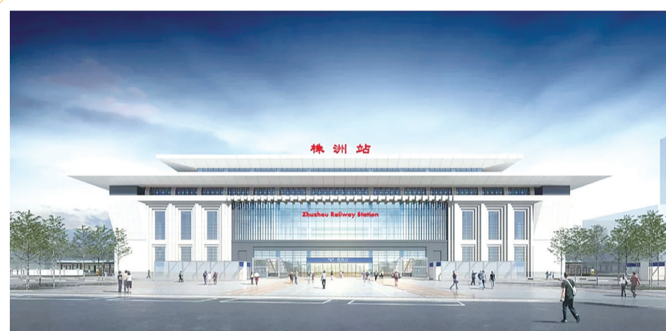
改扩建后的株洲火车站效果图。