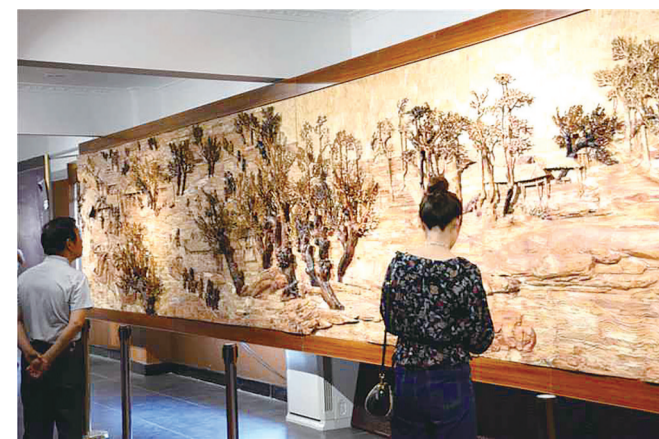
木雕《清明上河图》部分。