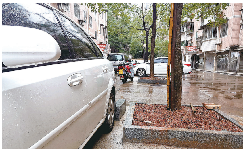
楠湖山庄小区大树之间空地将被变成停车位。

群众呼声就是第一信号。在广泛征求居民意见的基础上,香山社区向上级提交了老旧小区改造申请。今年,1栋至8栋被纳入今年的老旧小区改造范围,380万元改造费用由市、区两级承担。10月1日,施工单位进场开展3个月的施工,屋面防水、楼梯间粉刷、单元门禁更换、混凝土路面、给排水、监控安