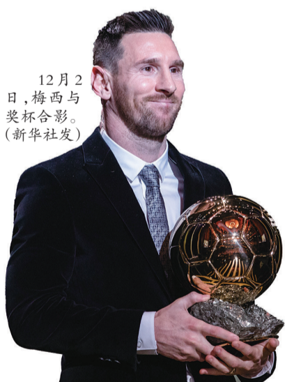
12月2日,梅西与奖杯合影。

据新华社巴黎12月2日电 2019年度“金球奖”2日晚在法国首都巴黎揭晓,西甲豪门巴塞罗那队长梅西第六次夺得“金球奖”,成为历史上获得该奖项最多的足球运动员。 “我第一次获得‘金球奖’是在10年前,我记得当时和我的兄弟们一起来领奖,那时我22岁。现在,10年过去了,我第六次获得了这个奖,这对我以及我的妻子和三个孩子来说都意义非凡。”32岁的梅西在颁奖典礼上说,“我知道年龄不饶人,但我希望在我职业生涯剩下的几年里,我依然能享受足球带来的快乐。” 梅西此前分别在2009、2010、2011、2012和2015年荣获“金球奖”。获得五次“金球奖”的克·罗纳尔多(C罗)在此次“金球奖”评选中,位列第三,他缺席了此次颁奖典礼。