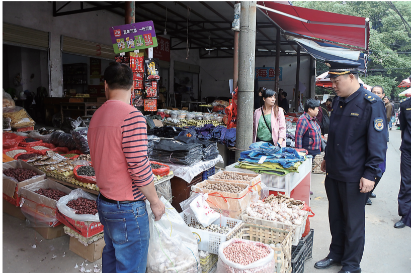
城管队员劝导出店经营行为。

同时,将城市管理、社会管理和公共服务事项纳入网格管理,加强各类基础信息的采集分析,并建立网格员、城管队员、保洁员之间的协调联动机制,构建工作处置微信平台,打破条