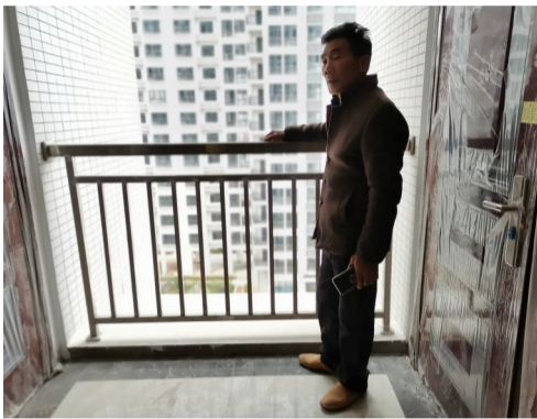
◀护栏高度在成年人胸部位置

本报讯(记者 姚时美)昨日,天元区型格·建宁翰府有业主拨打晚报新闻热线28829110反映,小区12